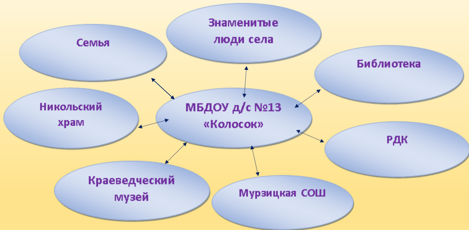
Схема взаимодействия ДОУ и социума